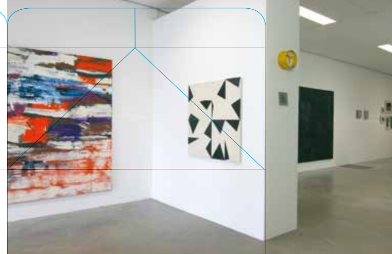
fragment uit de tumblr-achtige tentoonstelling 'milkshake 1'