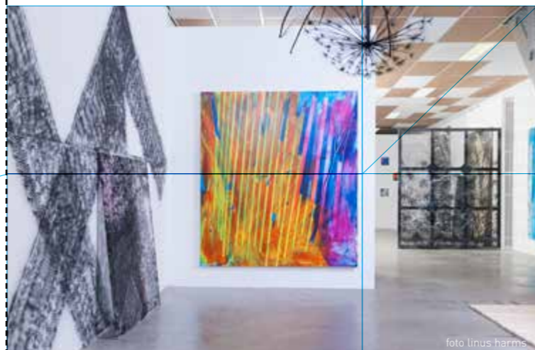
fragment '...invites nulvijftig', met o.a. ceiling piece van Wouter Niljand

melklokaal hoopt dat ook jij je, na het lezen van deze informatie en vooral na een bezoek aan melklokaal, wilt aansluiten bij de liefhebbers van melklokaal. Je kunt natuurlijk ook  nmalig een donatie doen als je hedendaagse kunst in Noord Nederland een warm hart toe draagt, maar je niet deel wilt uitmaken van de groep liefhebbers.