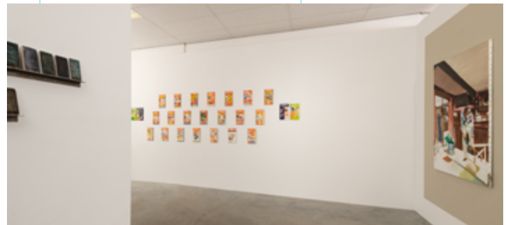
Fragmente uit 'All day every day' Maurice van Tellingen en Jelle Slof