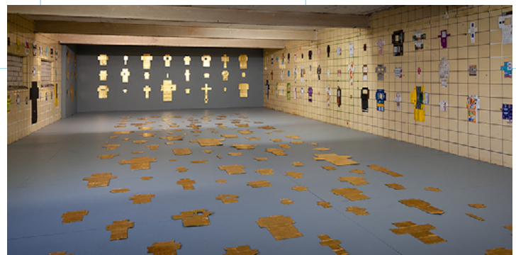
fragment ROOM 'Commercial Crosses' Akmar.

In mei wordt tijdens de 'vodka and cookies' (no milk) verdieppingsavond de tweetalige (NL-FRY) bibliotheek uitgave 'Ryzji yn it Frysk' gepresenteerd. In het Fries vertaalde gedichten van de Russische Boris Ryzji (1974-2001) door Eeltsje Hettinga met getekende Ryzji portretten door Jochem Hamstra. De fraaie handgebonden uitgave verschijnt bij Stichting Cephher in een limited edition van 100 gesignde exemplaren. Prijs 40 euro. Intekenen op een exemplaar kan ovr 'Ryzji' via: info@melklokaal.nl OP=OP!