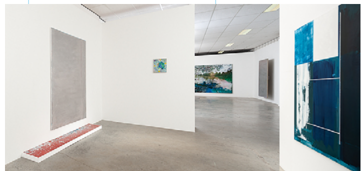
fragmenten groepstentoonstelling 'Attitudes'