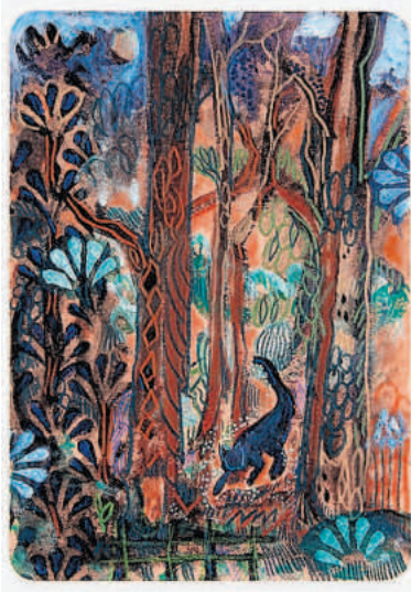
Kat Tún Jún.