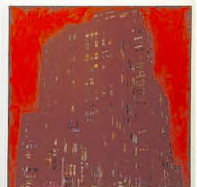
Martin de Jong - 'Midtown Building' (2021)