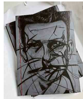
Ryzji yn it Frysk is een handgebonden tweetalige uitgave (Nederlands-Fries), met gedichten van Boris Ryzji – in het Fries vertaald door Eeltsje Hettinga – en tekeningen door Jochem Hamstra. Van deze genummerde en gesigeneerde uitgave zijn nog enkele exemplaren beschikbaar. Te verkrijgen voor 40 euro bij melklokaal in Heerenveen.