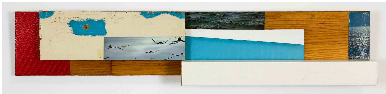
Jochem Hamstra: De zee , 2018

Heerenveen – melklokaal, Heremaweg 201 (voormalige zuivelfabriek Jagtlust), vr en zo 13-17 u t/m 7 juli, Ook open op afspraak. www.melklokaal.nl