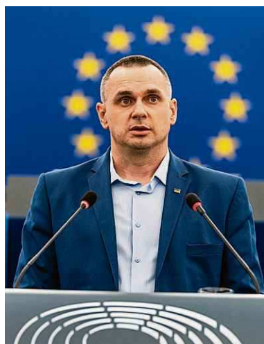
Oleg Sentsov

OLDEBERKOOP Kunstroute Open Stal in Oldeberkoop is beloond met de Henk Aalderink-prijs. Met de prijs (2500 euro) belooft de vakjury de organisatie die „onderscheidend is in zijn soort met de kracht telkens actueel te zijn”. De prijs is door P10 (netwerk van grote plattelandsgemeenten) in het leven geroepen om te laten zien dat het platteland bruist. Open Stal mag zich dit jaar – net als negentien andere geselecteerde evenementen of instellingen – Parel van het Platteland noemen. Hiervan komt een boekje met routekaart.