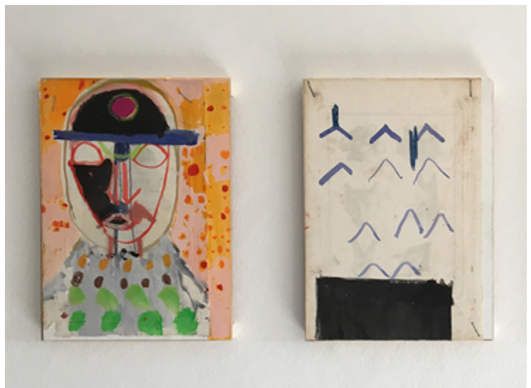
'hemelruimte weerspiegeling' en 'interpretatie', 2016, mixed media op hout, Manu Baeyens