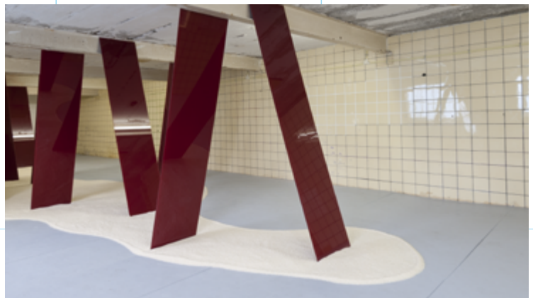
fragment ROOM: installatie Anouk Mastenbroek.