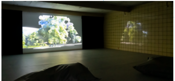
fragment ROOM Thijs Linssen