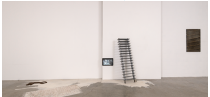
fragmenten solotentoonstelling Astrid Nobel