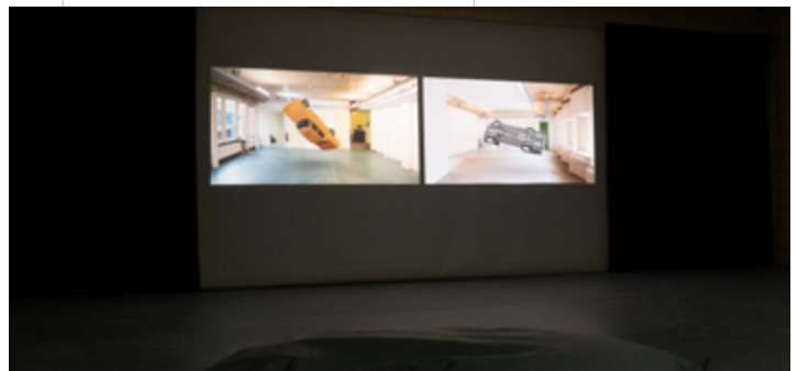
ROOM: video installatie 'Going nowhere' Thijs Linssen