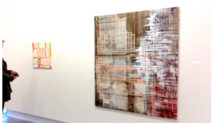
What does your soul look like (16), 2017, Machteld van Buren

melkbuzz niet meer ontvangen? klik hier om je uit te schrijven