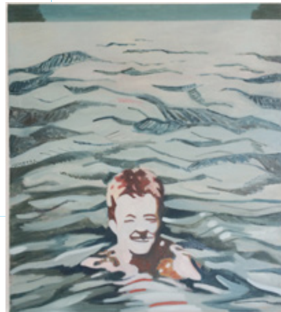
z.t., nr. 47 (52) februari 2011, olieverf op linnen, 90 x 80, Jochem Hamstra